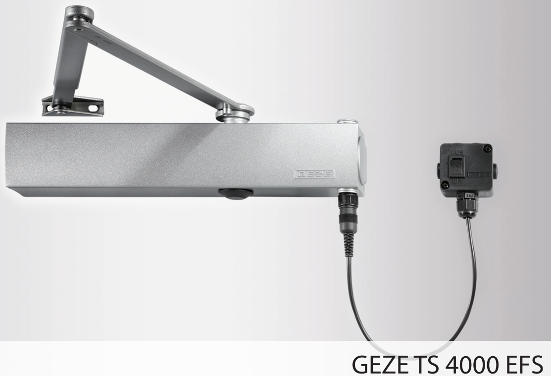
GEZE TS 4000 EFS

Nawierzchniowy samozamykacz drzwiowy z wyłączalną funkcją zamykania drzwi